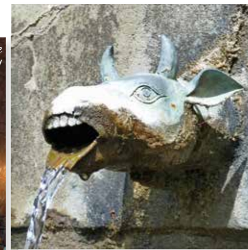
Helder bronwater klatert uit 103 koperen koeienkoppen