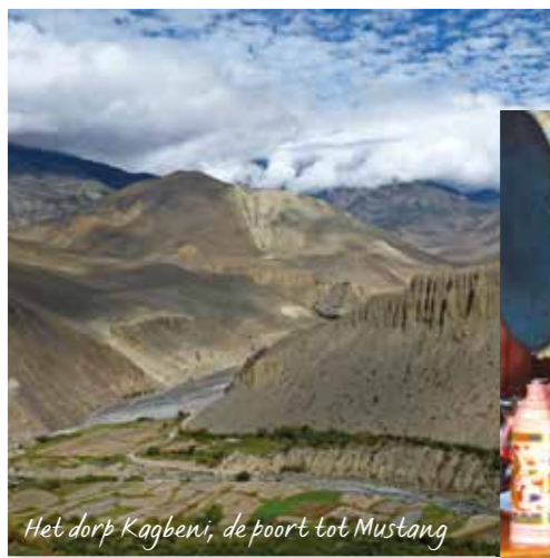
Het dorp Kagbeni, de poort tot Mustang