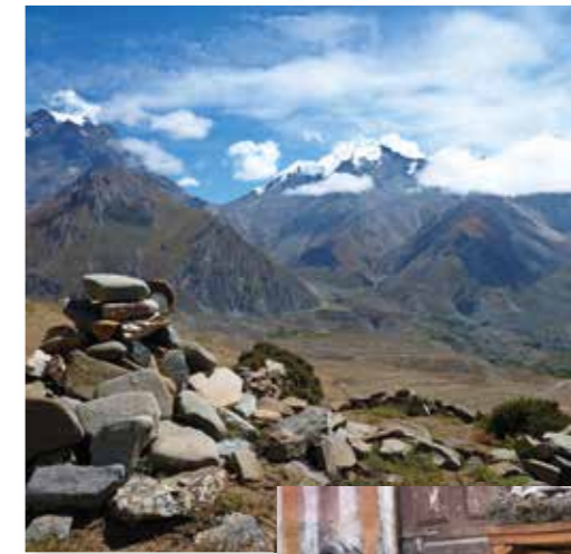
Gebedsstenen met uitzicht richting Muktinath. Links berg de Yakwakang en rechts de Khatungkang

Tegenwoordig reizen pelgrims vanuit het plaatsje Jomson, in het dal van de Kali Gandakirivier, per bus of jeep via een kronkelweg omhoog naar Ranipauwa, vlak onder Muktinath. Hier verrezen etablissementen die zich aanprijzen met super hot shower en zittoilet. Na de hotels, met klinkende namen als Bob Marley en Mona Lisa, stukt het vervoer en gaat het verder met de benenwagen. Trap treden leiden me naar ruim 3700 meter hoogte, tegelijkertijd voeren ze me terug in de tijd. Door mijn geologiestudie weet ik dat de machtige Himalaya ontstond doordat het Indiase continent tegen de Euraziatische plaat botste. De tussenliggende Tethys-oceaan werd dichtgeknepen. De nabijgelegen achtduizenders Dhaulagiri en Annapurna zijn het 'levende' bewijs van dit geologische geweld. Een ander overblijfsel van de continentbotsing is in Muktinath te vinden: uit rotsspleten wellen water en gas op. Het aardgas laat blauwe vlammen flakkeren. De ►