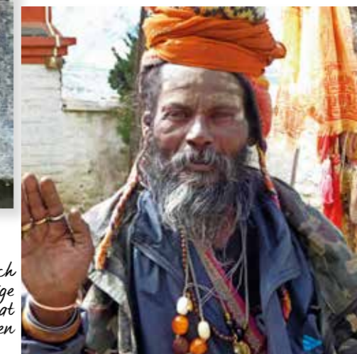
Een sadhoe, die zich graag in zijn kleurige outfit op een foto laat vereeuwigen

Ik voel me thuis en welkom. Er heerst een warme sfeer