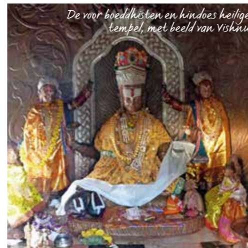
De voor boeddhisten en hindoes heilige tempel, met beeld van Vishnu