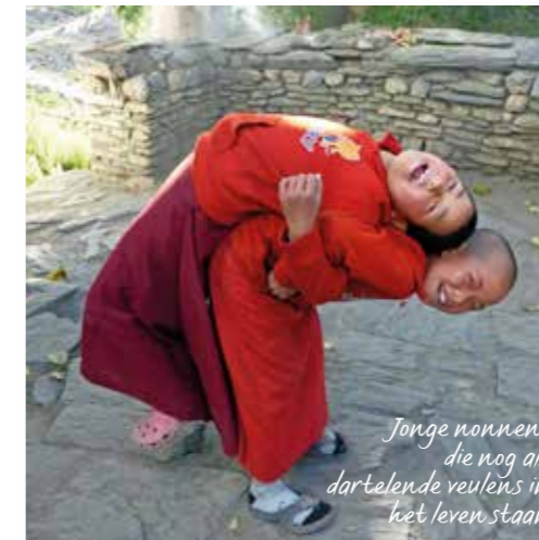
Jonge nonnen, die nog als dartelende veulens in het leven staan