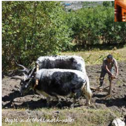
Oagst in de Muktinath-vallei