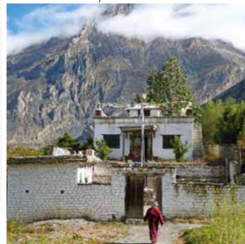
Boeddhistische tempel in Muktinath