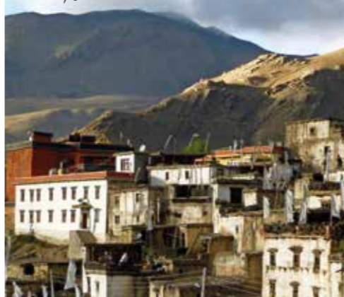
Het dorp Jharkot