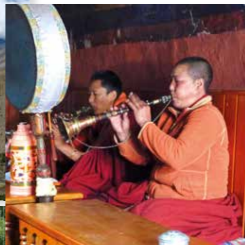
Gebedsdienst in de vuurtempel