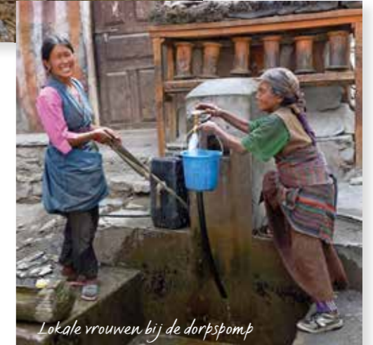
Lokale vrouwen bij de dorpspomp