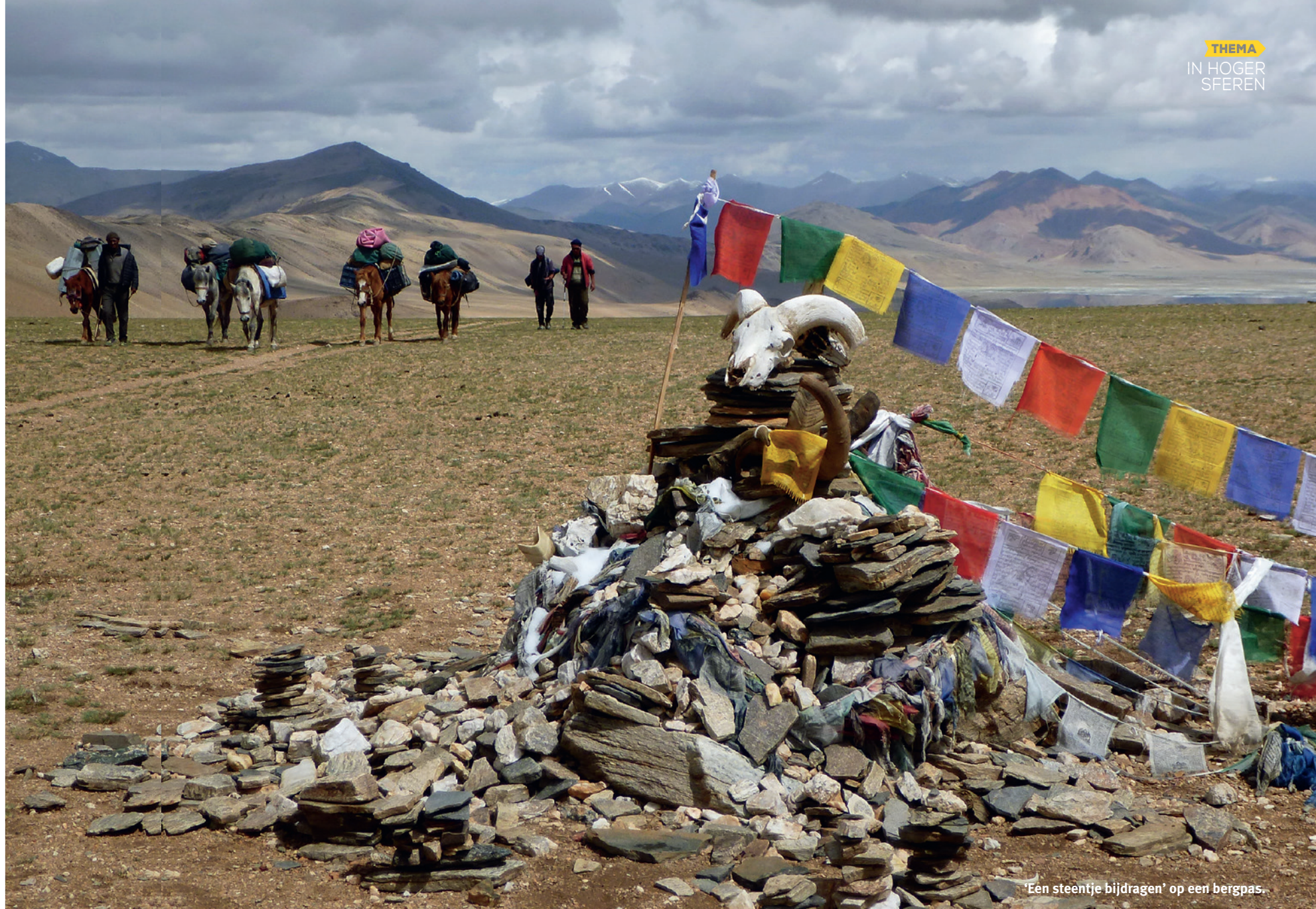
'Een steentje bijdragen' op een bergpas.

heb ik afzien ervaren, maar hoe langer deze bovenmenselijke inspanning duurt, hoe ongemakkelijker ik me voel. Dit gaat alle perken te buiten en is op de hellingen niet zonder gevaar. Het ego onderwerpen en levende wezens bevrijden van tegenslag en lijden, oké – maar is dit nog gezond? Bij het klooster staan dampende pannen rijst en groente. Daarna volgt een rondgang om het klooster, gedeeltelijk via trappen. Zijn de treden breed en lang, dan wordt er per trapree een prosternatie gemaakt. Is dat niet het geval, dan plooiën de prosternerende zich in bochten om zich uit te strekken. Goedgemutst duikt het gezelschap prosternerend de diepte in over puinhellingen met hoekige keien, over rotsen waarnaast de afgrond grijnst. Ik ben opgelucht als iedereen veilig de dalbodem bereikt. Daar wordt, lang uitgestrekt, zelfs een bevroren rivier overgestoken. Na tien uur lichamelijke inspanning is de klus geklaard: stoffig maar voldaan huiswaarts. Morgen weer een dag.