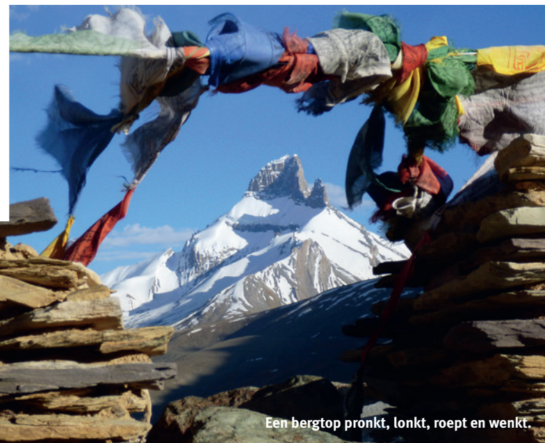
Een bergtop pronkt, lonkt, roept en wenkt.

veroorzaken. De lu zijn meer watergeesten, slangachtige wezens geassocieerd met de onderwereld. Die beschermers wonen in bronnen, verstilde meren of een knoestige jeneverbesboom. De hoeders van welzijn, water en geluk reageren boos op aantasting van hun woongebied. De tegenreactie van een lha of lu is ziekte of droogte. Karma toont me de woonplaats van een lu : een verweerd stuk graniet met een gat erin, waar gelovigen doorheen kunnen kruipen. De lu -steen is prozaïsch in cement verankerd, zodat het natuurwonder niet kan wankelen. Aan de buitenmuur van een huis hangt een demonenverschrikker, een kleurig draadwerk rond een geitenschedel. In de bergen is de kwetsbaarheid van de mens invoelbaar. Daarom worden offers achtergelaten, alsof een bergtop of sacrale plek een persoonlijkheid bezit. In de bergregio's, waar de dood vaak dichterbij lijkt dan in het laagland, wordt het kwaad tijdens rituelen verjaagd of verbrand.