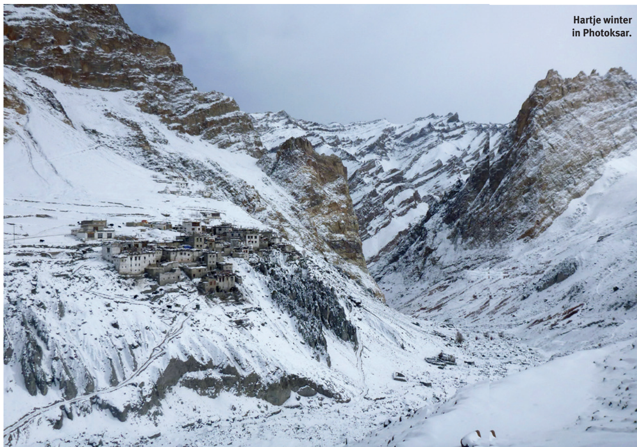
Hartje winter in Photoksar.