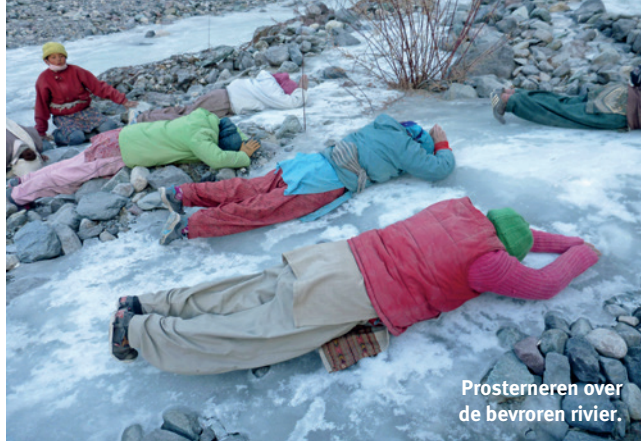
Prosternerer over de bevroren rivier.