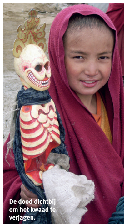
De dood dichtbij om het kwaad te verjagen.

Een menselijke rups trekt door de bergen – de handen gevouwen boven de kruin, voor het voorhoofd, keel en borst, om zich op de bevroren ondergrond uit te strekken. De hele dag trek ik met de groep op. Ik maak geen neerbuigingen. Tijdens bergbeklimmen