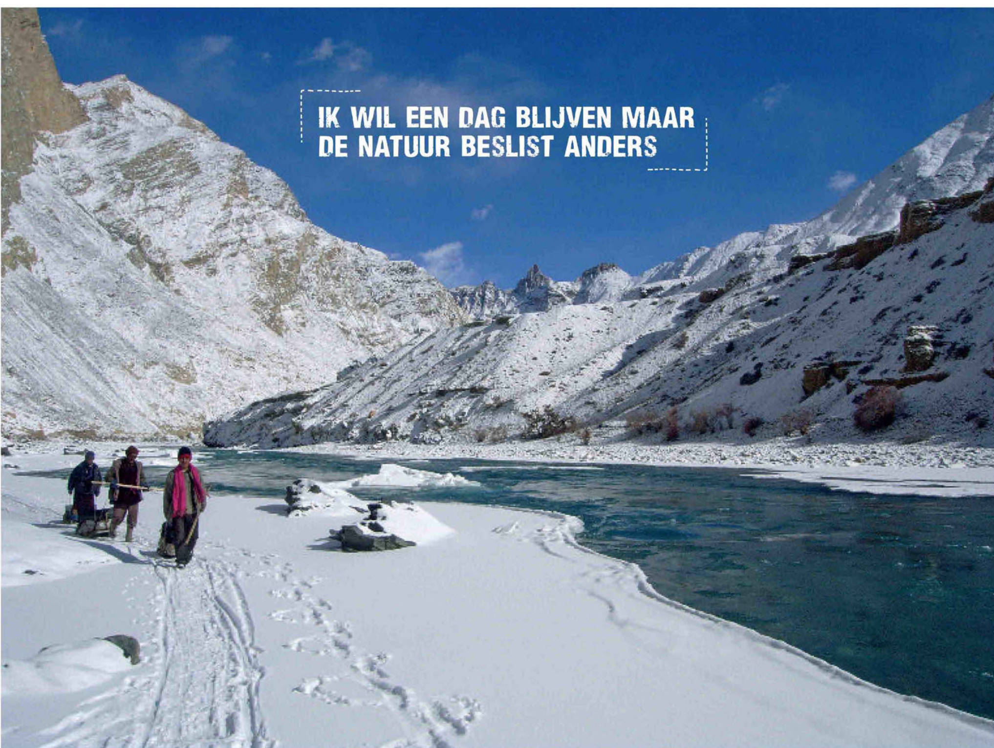
De Zanskar is gedeeltelijk bevroren.

omstandigheden zou je mijn beslissing om samen deze tocht te maken naïef kunnen noemen, maar het voelt vertrouwd.