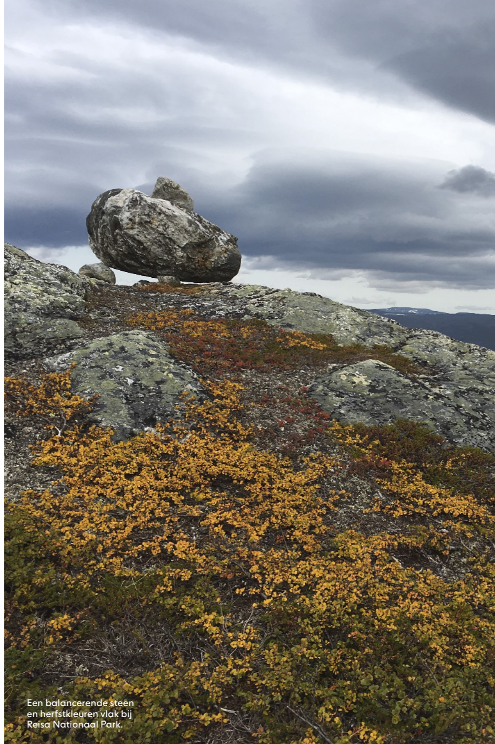
Een balancerende steen en herfstkleuren vlak bij Reisa Nationaal Park.

Ik steek rivieren over via schommelende hangbruggen, balancerend op stapstenen of met waadschoentjes. Het weer kan wispelturig zijn: wind, mist, regen, zonneschijn en zelfs een sneeuwbuï. Vier seizoenen op een dag. Ik voel me hier één met de natuur. Een rotsblok is doormidden gebroken, alsof een reus hem met een zwaard doorkliefde. Traag groeiend korstmoss verover