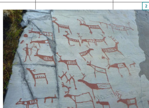
2 Rotstekeningen bij Alta.