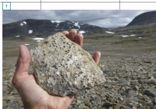
1 Granaatglimmerschist, miljoenen jaren aardgeschiedenis balancerend in mijn handpalm.

storm dagenlang vast in onbemande berghutten en wekenlang kom ik geen mens tegen. Ik moet mijn alpinistenervaring aanspreken. De sneeuw- en weerscondities zijn regelmatig slecht en ik kampeer bij temperaturen ver onder nul. In de winterperiode zijn de bergen grotendeels bedekt met sneeuw en ijs. De geologie laat zich dan beduidend minder lezen. Toch zijn het ook daar regelmatig stenen die voor gezelschap zorgen. Zoals tijdens een nacht in een tent op een plaats waar de verijsde sneeuw een ijsvloer lijkt en ik mijn kampplaats kies op een door de wind schoon geblazen mossig steenveld naast een steenman van de zomerroute. Ik kan geen haringen kwijt, want onder het mos ligt vast gesteente. Daarom veranker ik mijn tent met keien en staat hij als een huis. Sneeuwvlokken nestelen zich als een zijden sjaal op het tentdoek. Ik smelt sneeuw op mijn brander voor thee en een maaltijd. Daarna kruip ik rap mijn slaapzak in, op een sublieme slaapplek met een weids bergpanorama en rotsblokken als stille burens. Ik sluit eind februari mijn eerste etappe af.